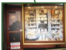
28 Grande Rue

Installées depuis début juin 2011, les vitrines virtuelles représentent une opération lancée sous l'égide de l'Union Commerciale, Artisanale et Industrielle de Domfront (UCAID), avec la participation la Ville de Domfront, de la Chambre de Commerce et de l'Industrie Flers-Argentan, GIP Adeco - Pays du Bocage et le Crédit Agricole.