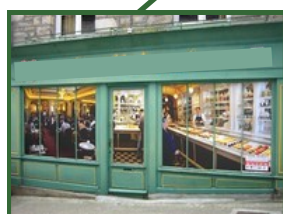
24 Grande Rue