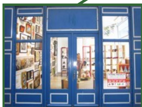
50 Rue du Dr Barrabé