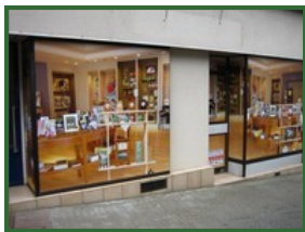
9 Grande Rue