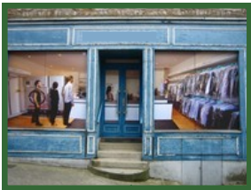
6 Rue St Julien