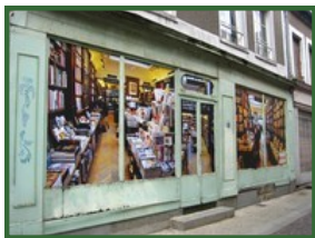
21 Rue St Julien